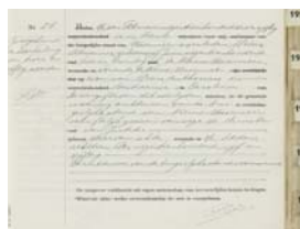
3 Meeus Adrianus

I. Adrianus Meeus (afb. 3), geboren op 5 juni 1922 in Nieuw-Vossemeer. Adrianus is overleden op 1 februari 1953 in Nieuw-Vossemeer, 30 jaar oud (oorzaak: watersnoodramp). Van het overlijden is aangifte gedaan op 18 mei 1955 [bron: akte 58].