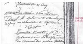
6 Loon Christianus 1727 03

III. Dymphna Dingemans , geboren in Kruisland (zie 11).