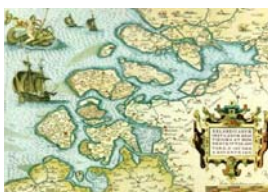
4 oude kaart van zeeland en West Brabant