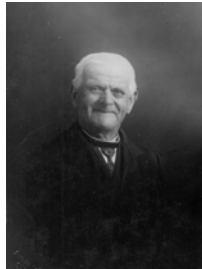
11 Reunie 2005 017