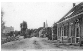
11 Reunie 2005 017