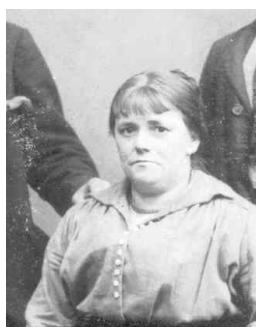
3 Cameron Cornelia 1875 01